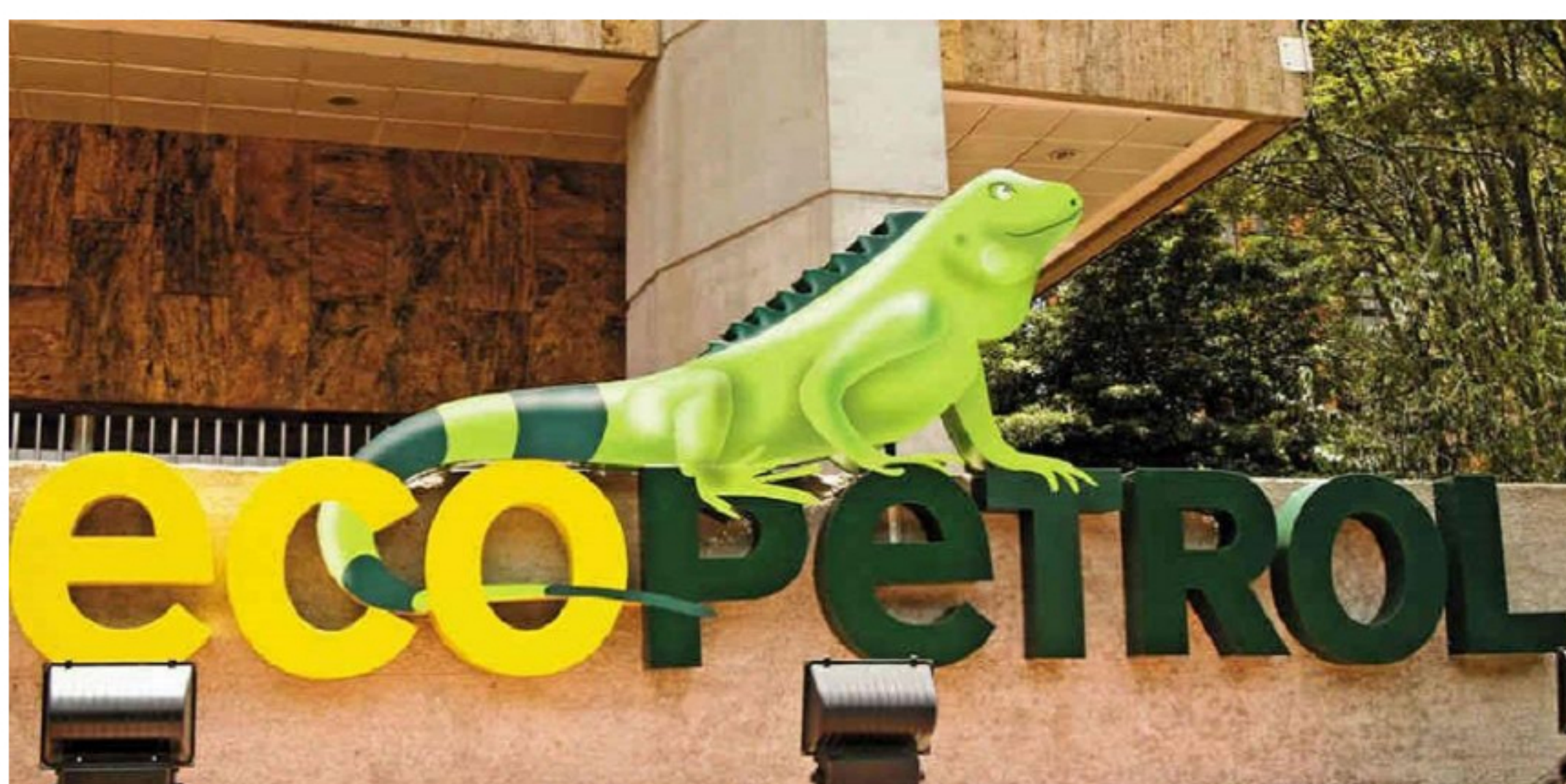
Ecopetrol no se deja contagiar de covid y gana 42 millones de dólares el segundo trimestre

Con información de nuestro aliado ElEconomistaAmerica.com