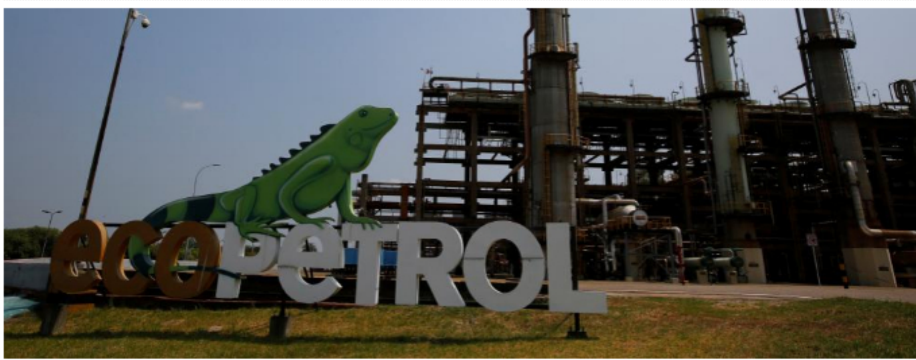
Los resultados de Ecopetrol se conocieron después de que la petrolera estatal mexicana Pemex y Petrobras de Brasil reportaron pérdidas de alrededor de US$1.900 millones y US$524 millones, respectivamente.

Los resultados se han visto afectados principalmente por la crisis en el sector petrolero derivada de la pandemia de coronavirus, que afectó a la industria ante las restricciones de movilidad y su posterior recorte de producción del crudo.