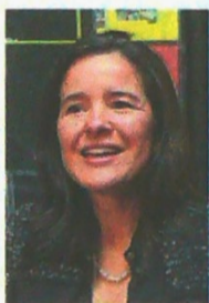
Sylvia Constaín, la ministra saliente, estuvo en el cargo desde agosto de 2018.

700 MHz, que se hizo el año pasado, y que requiere de acompañamiento y diálogos con las comunidades en las que se instalarán los recursos técnicos necesarios.