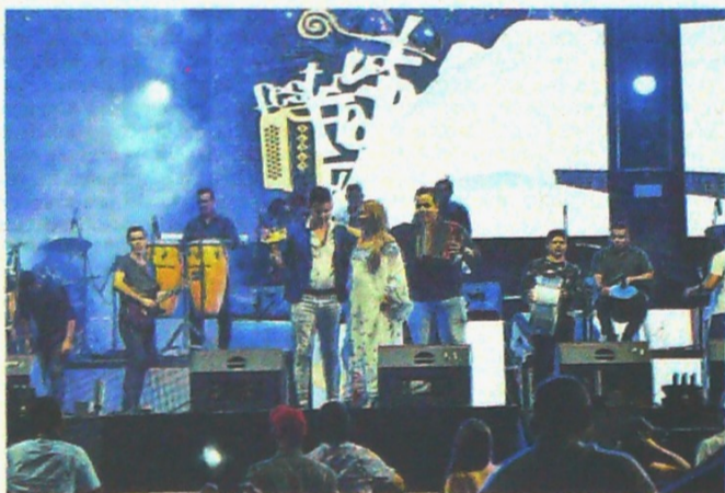
El Festival Francisco El Hombre, competencia de grupos vallenatos, estaba entre los eventos comercializados por los operadores.

EL TIEMPO indagó con el Gobierno sobre el reemplazo de Abudinen en la Alta Consejería para las Regiones, en la Consejería Política y en la Gerencia para Colombia de la Asamblea Anual del BID, que se iba a realizar en marzo y que fue aplazada debido a la expansión del coronavirus, pero aún no se conocen los nombres.