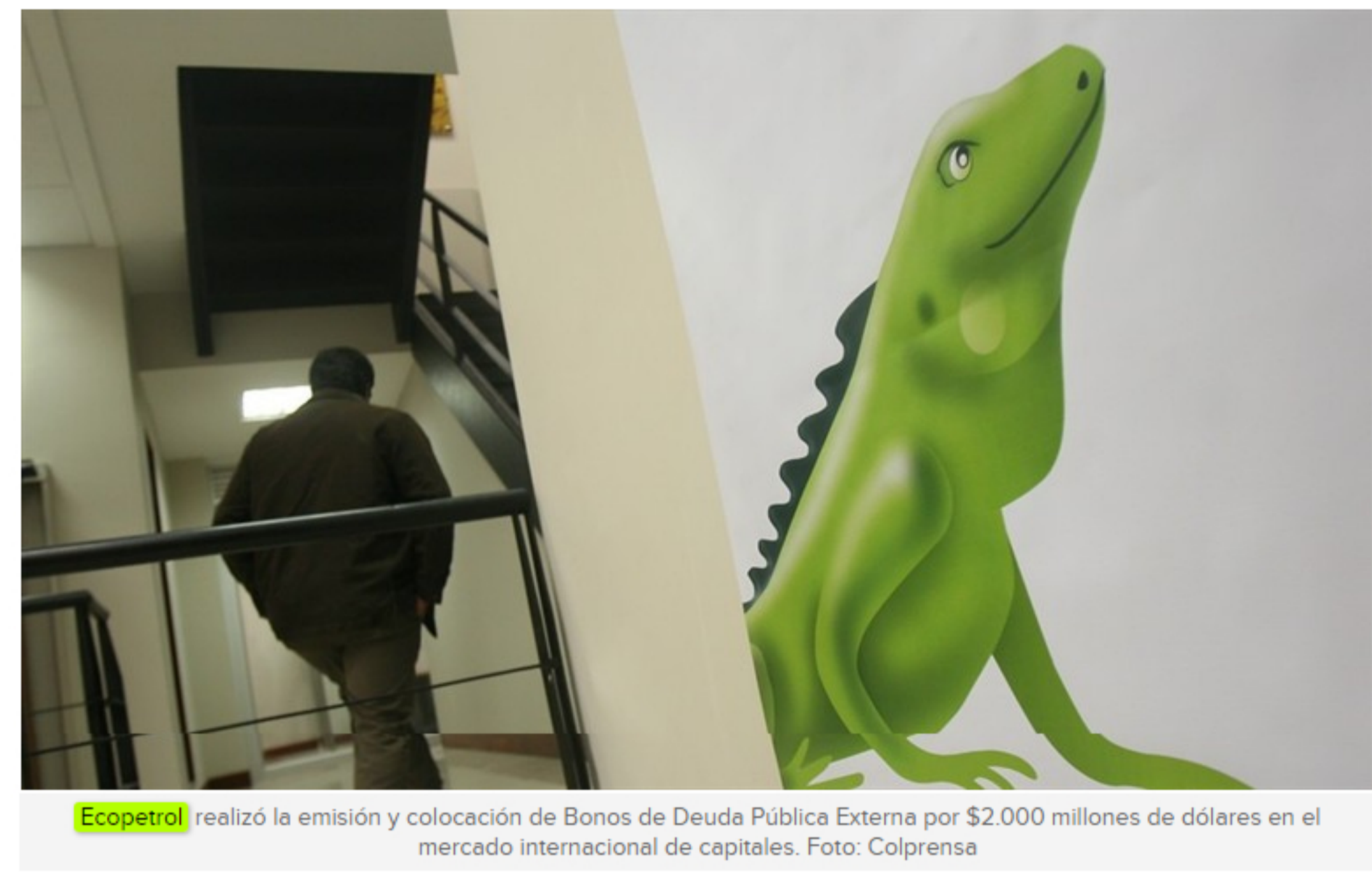
Ecopetrol realizó la emisión y colocación de Bonos de Deuda Pública Externa por $2.000 millones de dólares en el mercado internacional de capitales.

La estatal emitió Bonos de Deuda Pública Externa por US$2.000 millones.