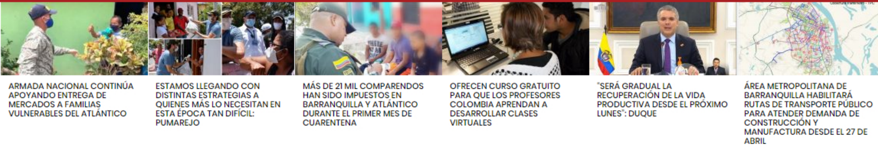
ARMADA NACIONAL CONTINUA APOYANDO ENTREGA DE MERCADEROS A FAMILIAS VULNERABLES DEL ATLANTICO