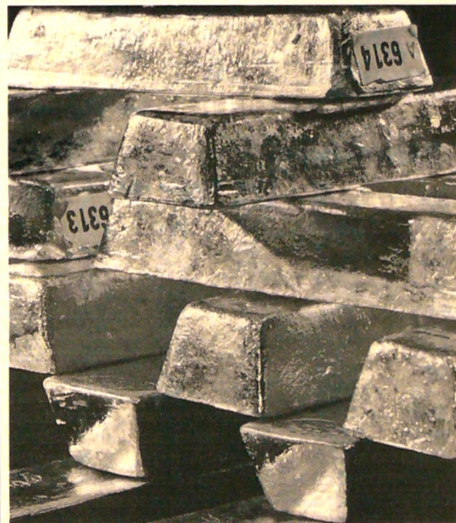
El récord de US$1.921,17 se estableció en septiembre de 2011.

Sin duda, un dólar fuerte, una menor volatilidad del mercado financiero y una caída de la demanda de joyas en India y China podrían seguir siendo vientos