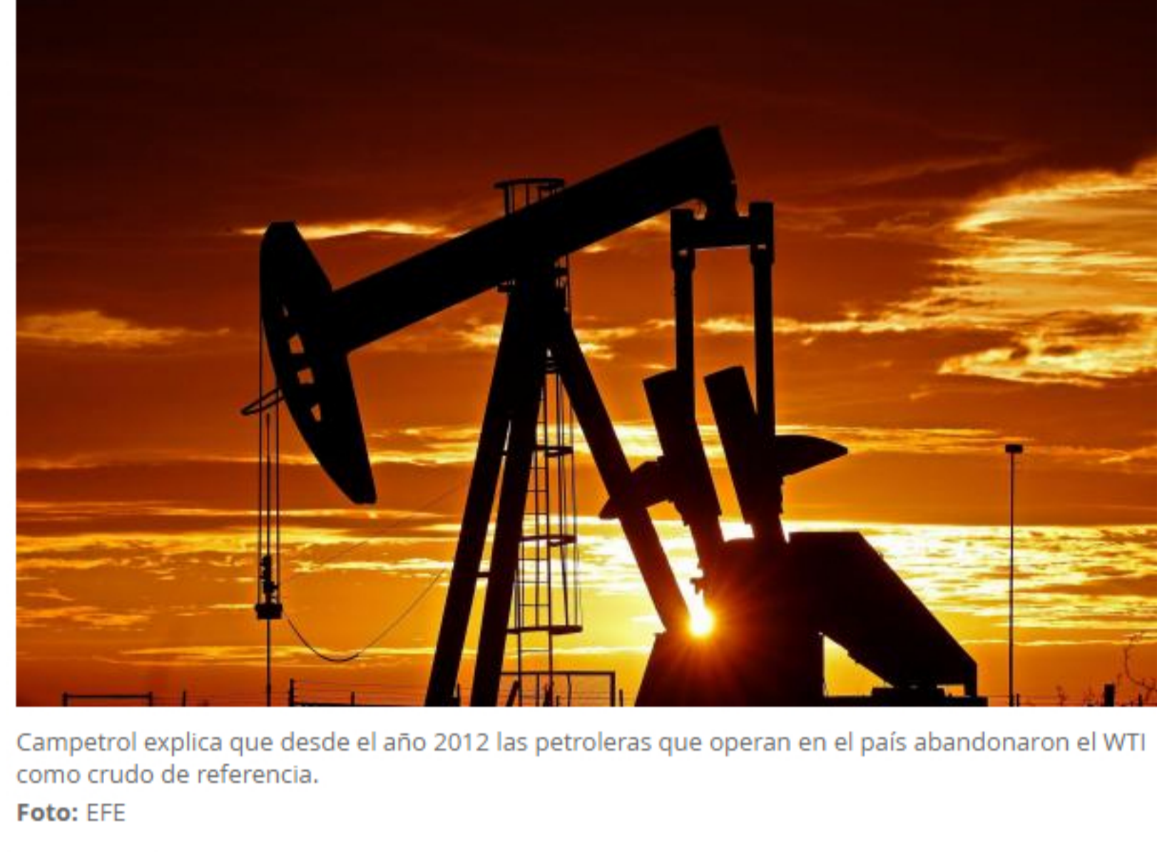
Campetrol explica que desde el año 2012 las petroleras que operan en el país abandonaron el WTI como crudo de referencia.

“La caída tan marcada del WTI no es un reflejo de las condiciones reales del mercado, es más bien un efecto causado por su vencimiento en bolsa y, a mediados de semana, que el contrato con entrega a junio pase a ser el genérico del mercado, se observará una normalización de la cotización”, señaló el dirigente gremial.