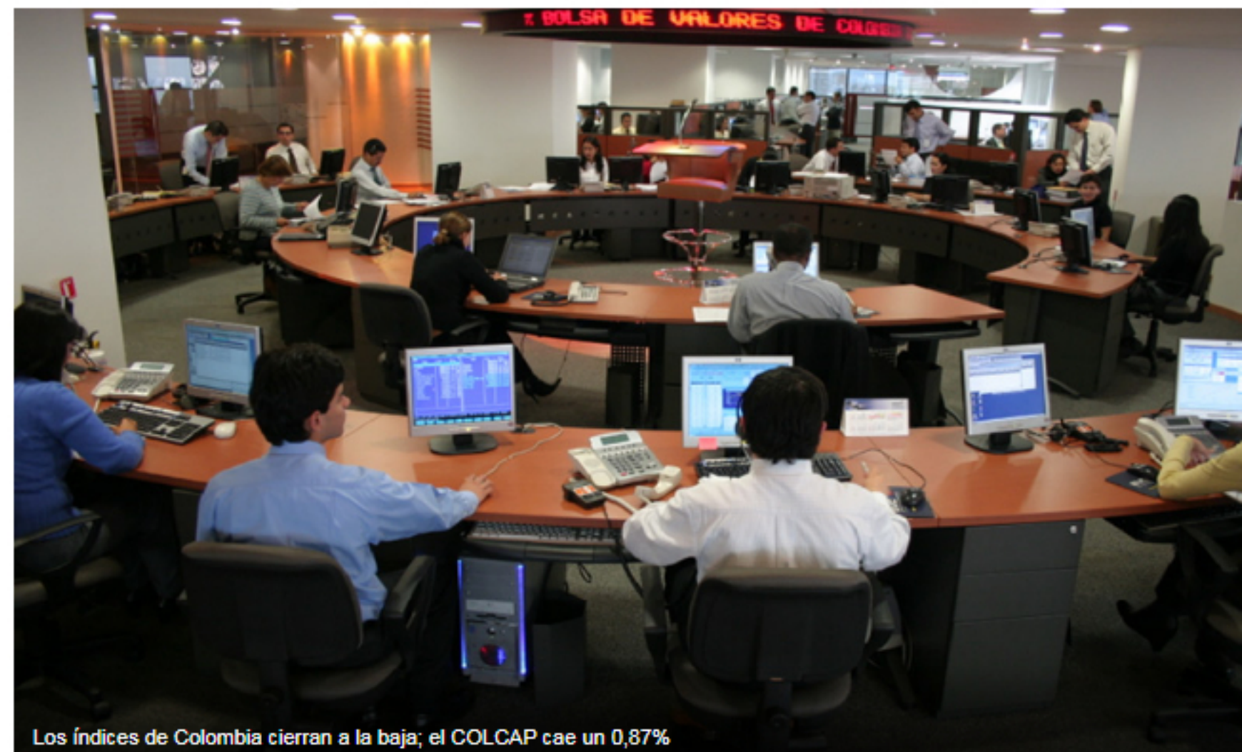
Los índices de Colombia cierran a la baja; el COLCAP cae un 0,87%