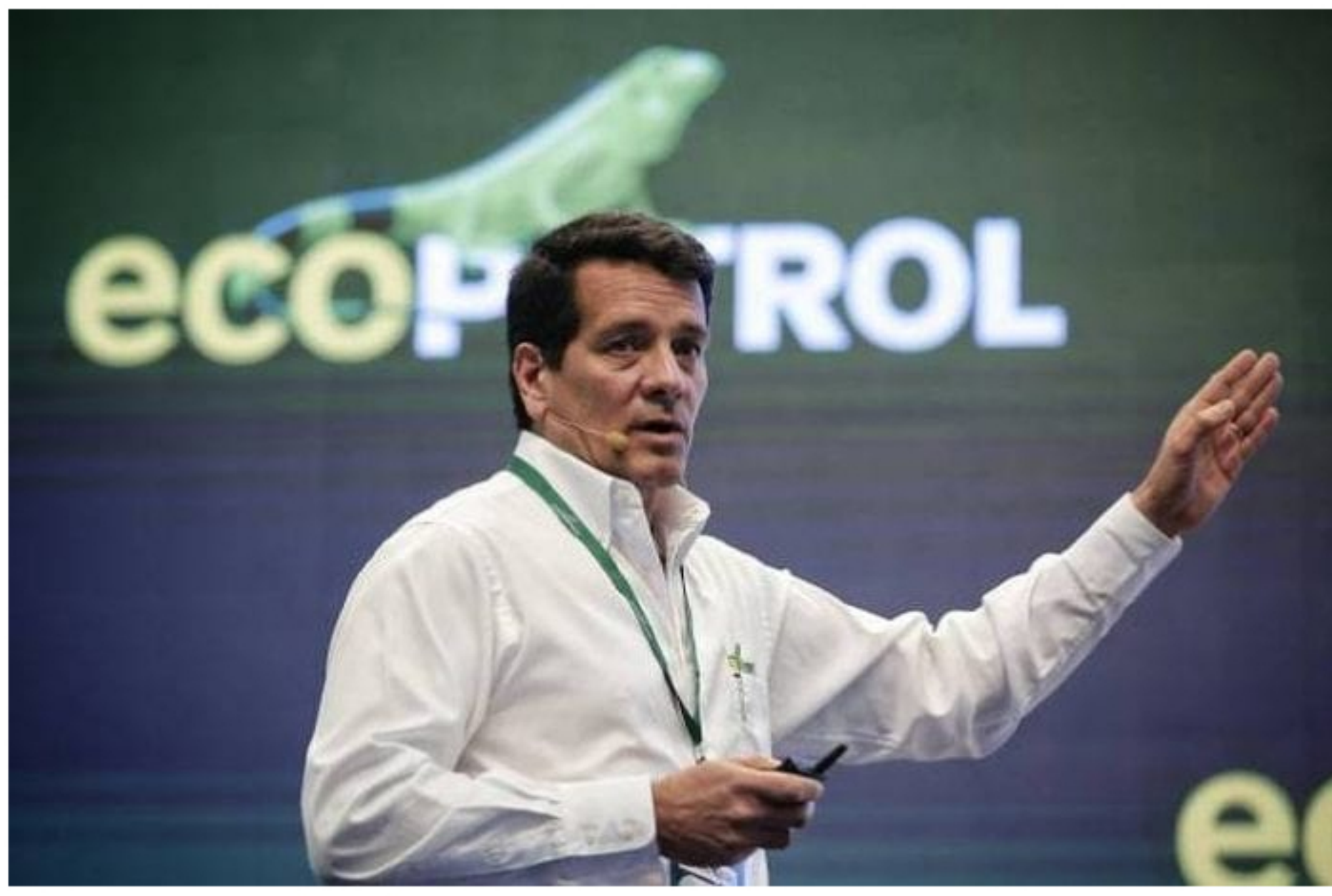
Felipe Bayón, presidente de Ecopetrol

Como parte de su estrategia de gestión integral de deuda y con el objetivo de preservar una sólida posición de caja en la coyuntura actual, Ecopetrol accedió a la totalidad de los recursos asociados a la línea crédito contingente de financiamiento por US$665 millones contratada con Scotiabank (US$430 millones) y Mizuho Bank (US$235 millones) en septiembre de 2018.