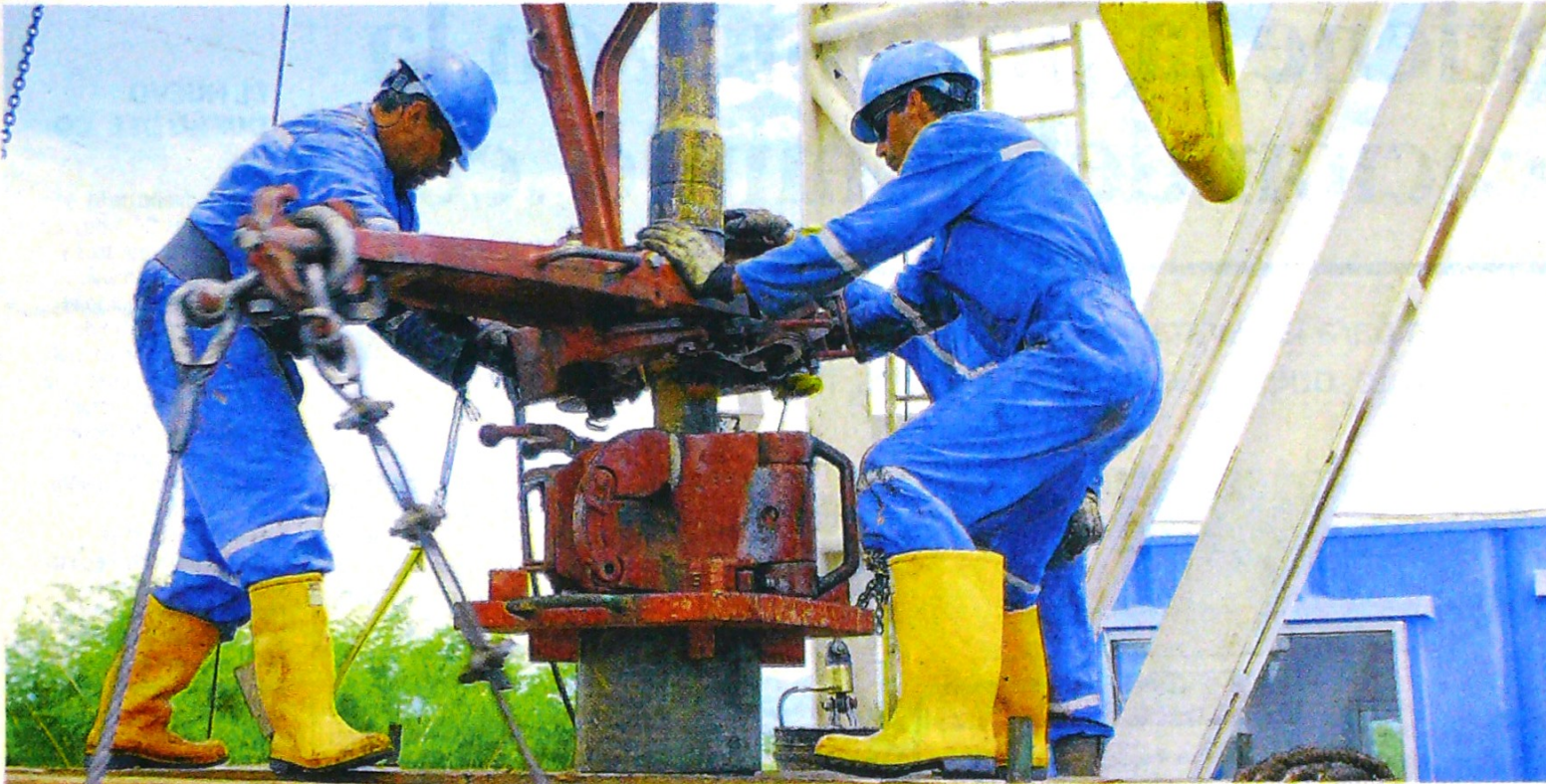
Voceros de Ecopetrol afirman que "la mayoría de campos que desarrollan en el territorio nacional son viables con los precios actuales del barril".