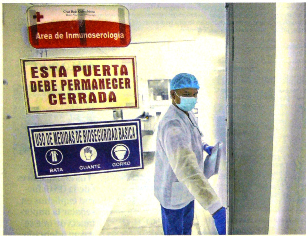
El banco de sangre de la Cruz Roja colombiana se está quedando sin inventarios para atender la emergencia.

REFORMA TRIBUTARIA: NO ES TIEMPO DE DEBATE Expertos y líderes gremiales coinciden en que el proyecto será necesario, pero hay consenso en que por ahora la prioridad es atender la emergencia de salud.