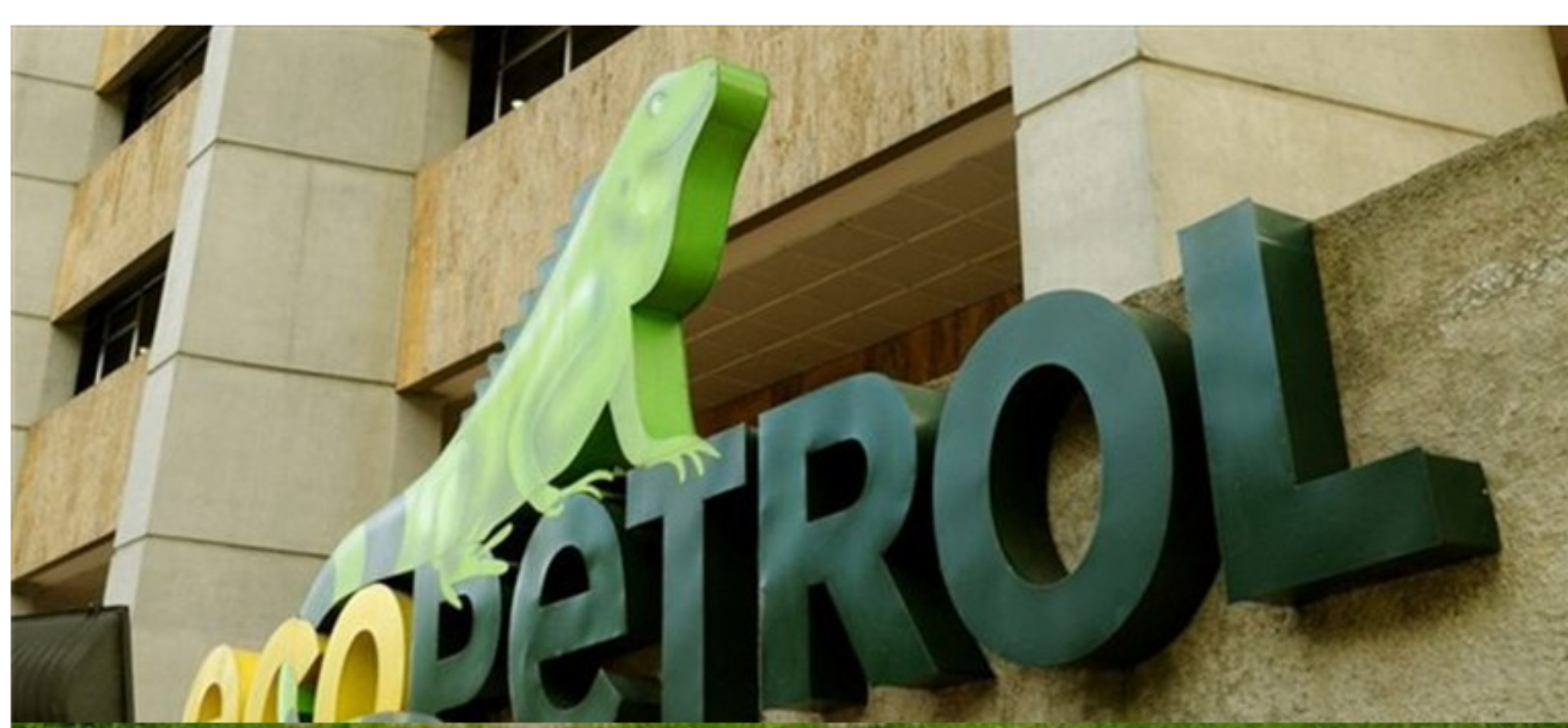
Ecopetrol anunció segundo paquete de ayudas para reforzar la salud en Colombia.

Con este segundo paquete de ayudas, Ecopetrol hizo aportes por 48 mil millones de pesos para sumarse a la lucha contra el covid 19