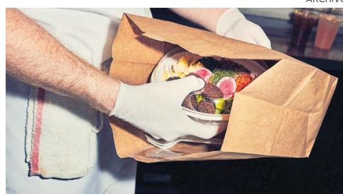
Un operario de un restaurante empaca un pedido.