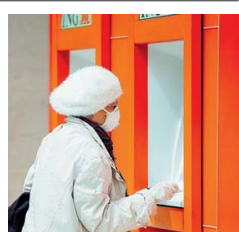
Una mujer retira dinero en un cajero electrónico.

En primer lugar, se aconseja crear un fondo de emergencia con el dinero de gastos diarios que ha dejado de hacer como transporte, comida fuera de casa y gastos hormiga.