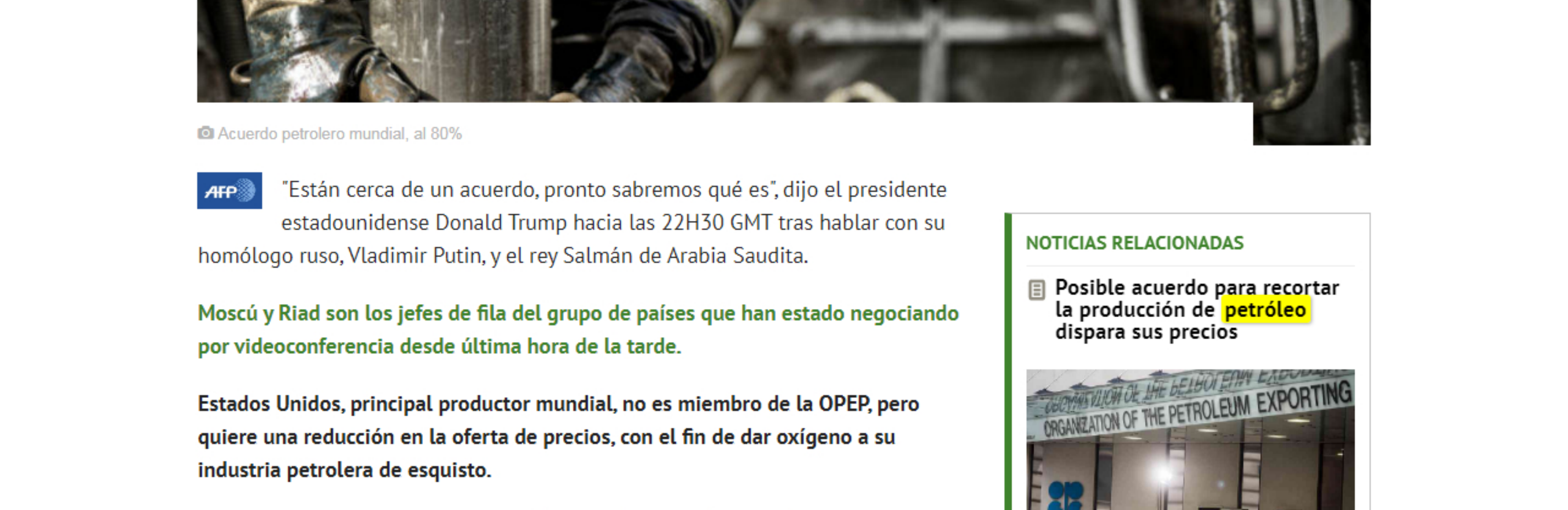
© Acuerdo petrolero mundial, al 80%

Los principales países productores de petróleo, encabezados por la OPEP y Rusia, intentaban este jueves por la noche ultimar un acuerdo sobre un recorte masivo de la producción para respaldar los precios que se desplomaron con la pandemia de COVID-19.