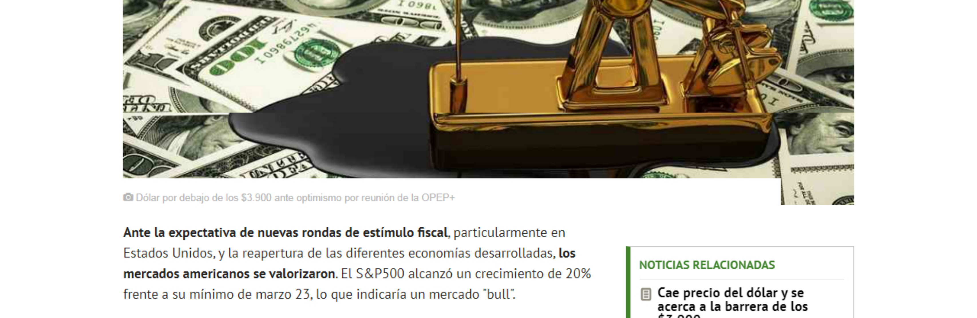
© Dólar por debajo de los $3.900 ante optimismo por reunión de la OPEP+

Ante el optimismo sobre el resultado de las reuniones petroleras que se desarrollaron al final de esta semana, el peso colombiano se revaluó y se ubicó por debajo de los $3.900.