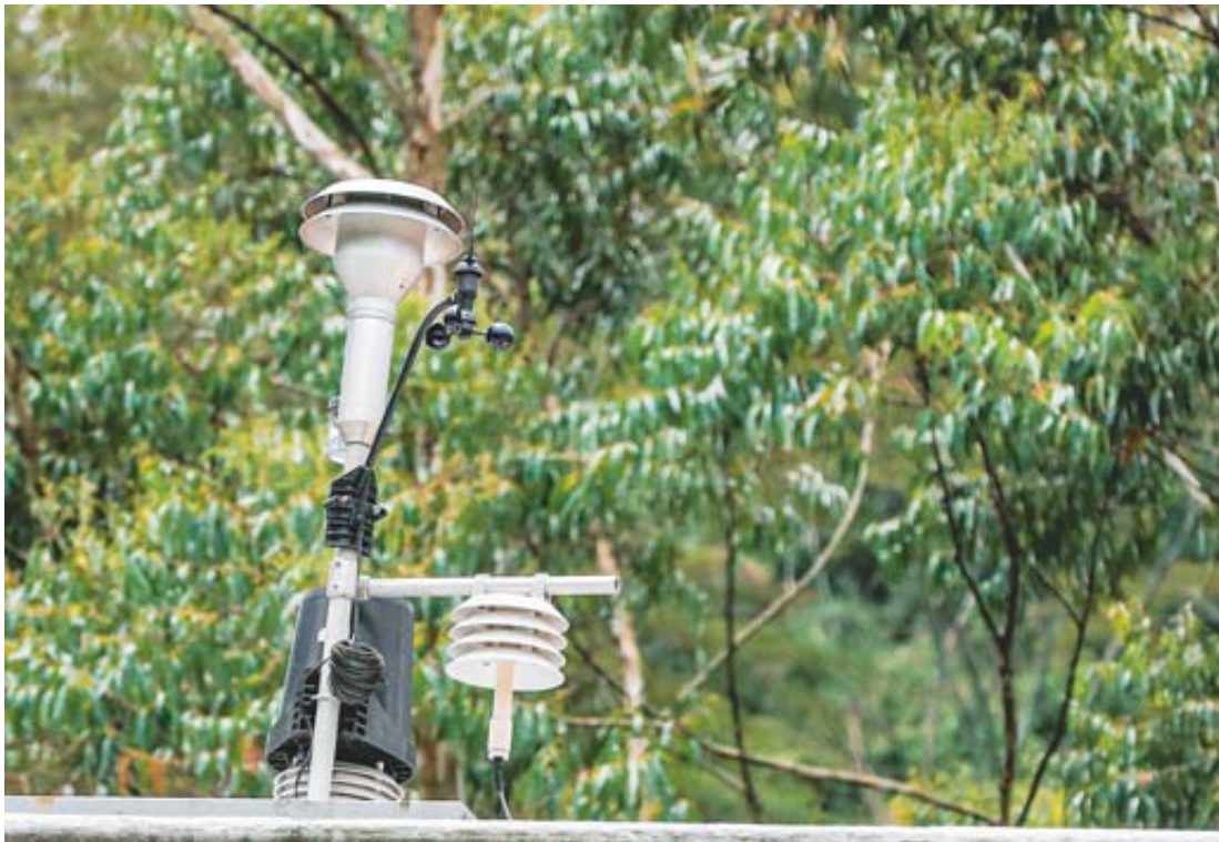
La de Altavista fue la primera estación de monitoreo de calidad del aire que instaló Corantioquia en el Valle de Aburrá. Esta solo mide concentración de PM 10, no 2.5.