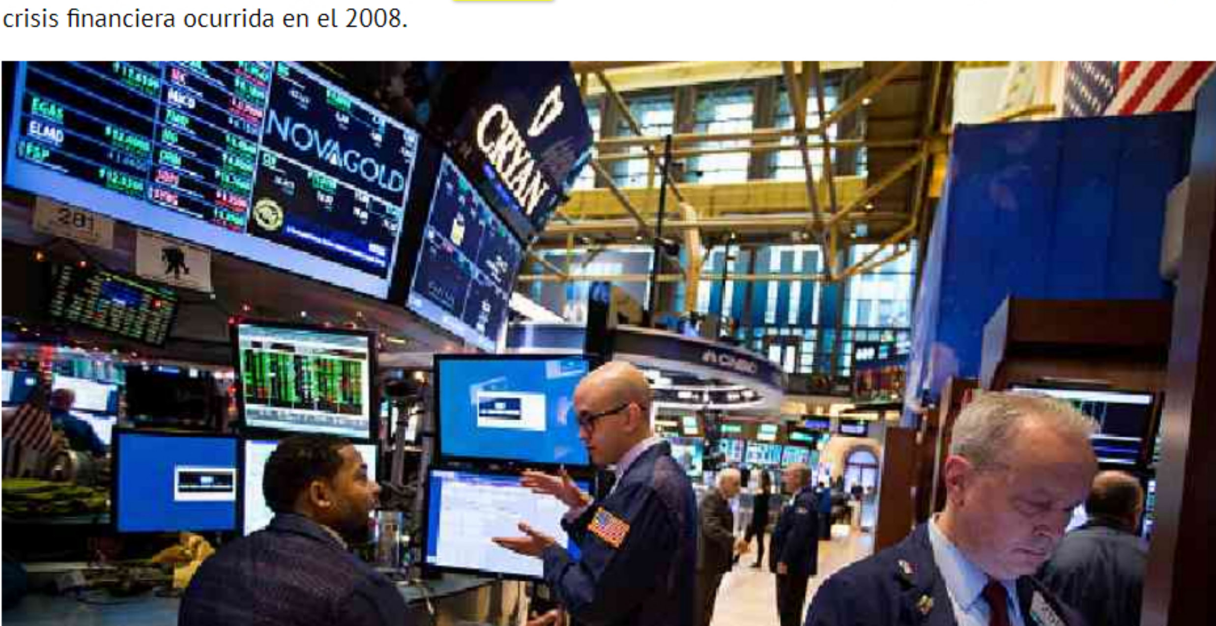
La peor semana de la historia para los mercados mundiales

El fuerte ajuste en la bolsa, el dólar y el petróleo marcan esta semana como la peor registrada desde la pasada crisis financiera ocurrida en el 2008.