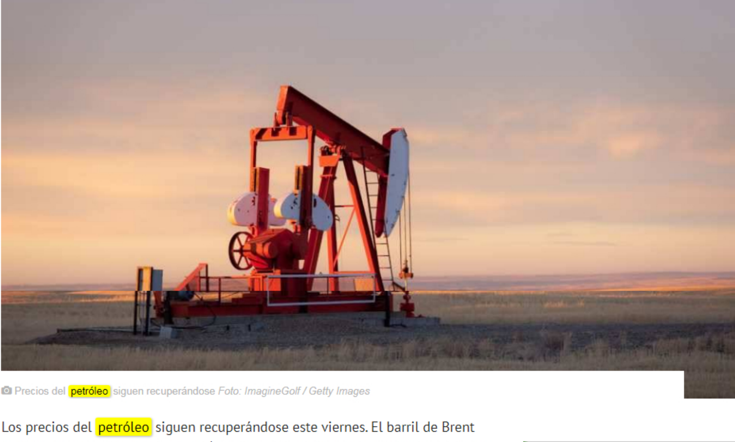
Precios de petróleo siguen recuperándose

Luego de que Donald Trump revelara posibles acercamientos entre Rusia y Arabia Saudita el precio del crudo sigue en alza. ¿Por qué es una gran noticia para el país?