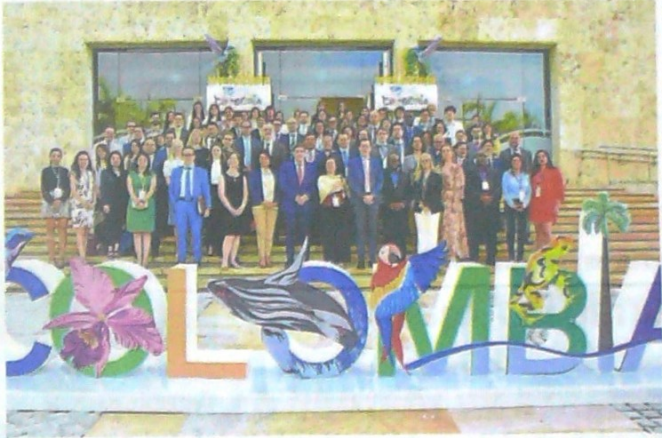
Más de 60 autoridades del mundo, encargadas de velar por la protección de los derechos de los consumidores, asisten a la Conferencia Anual de la Red Internacional de Protección del Consumidor en el Centro de Convenciones.

nes y protegen los derechos de los consumidores. Estos locales deben tener Registro Nacional de Turismo (RNT), y que si se presta en una propiedad horizontal esté permitido. Las páginas web deben cumplir con el Estatuto del Consumidor, dijo Barreto. Los servicios se ofrecen en ciudades como Bogotá, Medellín, Cartagena, Santa Marta, Cali y San Andrés, entre otras.