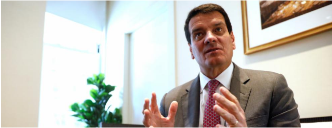
"Creo que en la segunda mitad del próximo año, estaremos listos para comenzar a perforar", dijo Bayón a Reuters en una entrevista en Nueva York. "El ministerio está trabajando en los protocolos. Tardarán algunos meses, saldrán y luego podremos solicitar las licencias".

Los pilotos son parte de los esfuerzos del país sudamericano para determinar si se permitirá la fracturación hidráulica que rompe las formaciones rocosas con líquido presurizado para la producir hidrocarburos.