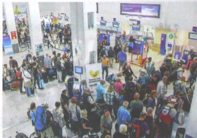
EL TUOPERADOR ESTÁ PRESENTE en Cuba, México, Tailandia, China, Emiratos Árabes Unidos o las islas Maldivas.

Thomas Cook está presente en Cuba, México, Tailandia, China, Emiratos Árabes Unidos o las islas Maldivas. Pero sus principales destinos se encuentran en el sur de Europa y en países