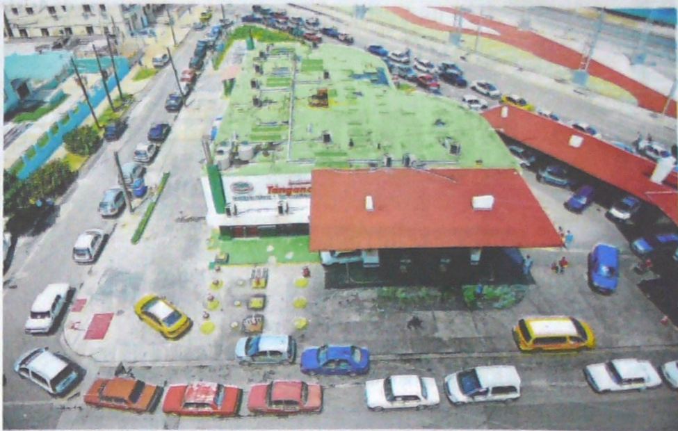
DURANTE EL FIN DE SEMANA aún se observaban muchas colas, a menudo con varias horas de espera, frente a las gasolineras del país.

Cuba enfrenta desde hace unos diez días una grave escasez de combustible relacionada a las sanciones estadounidenses contra las navieras que transportan petróleo de Venezuela, el principal proveedor de crudo de la isla. La producción de cigarrillos ha sufrido también "una ligera afectación"