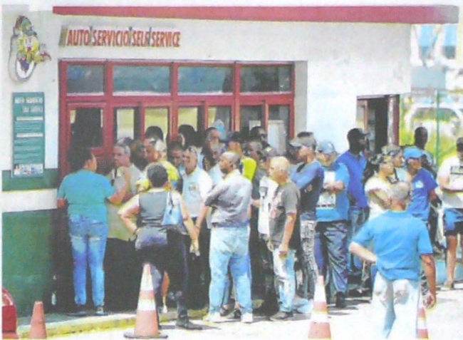
PRODUCTOS COMO los de higiene y cigarrillos en estos momentos presentan un déficit en los mercados.

"Tal situación ha motivado a tomar otras medidas, como ubicar los artículos más demandados en sitios más cercanos a la población y a los mercados, o buscar tiendas con mayor capacidad de recepción desde donde