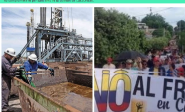
La Corte Constitucional autorizó los 'pilotos' que permitirían adquirir por vía experimental el conocimiento que hoy no se tiene del 'fracking'.

Por: Juan Manuel López | septiembre 25, 2019