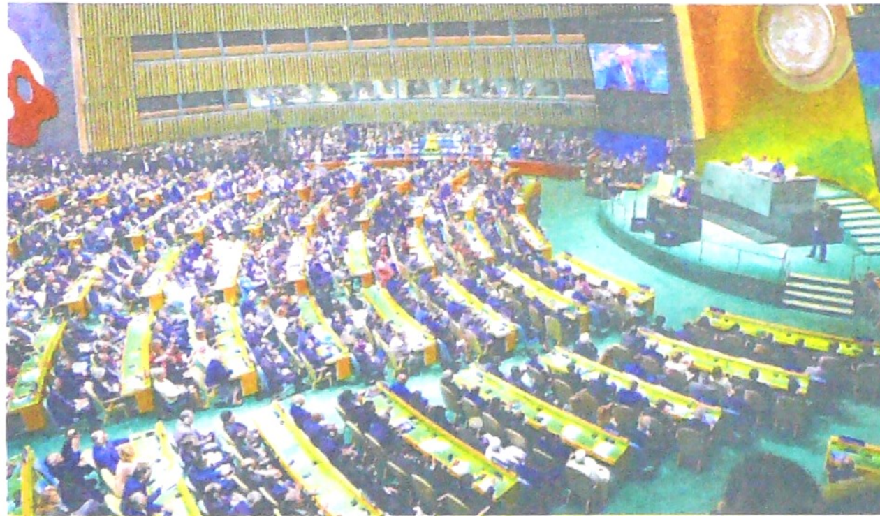
El presidente colombiano, Iván Duque, intervendrá hoy ante los líderes mundiales reunidos en Nueva York.

La pelea entre el 'globalismo' y el 'patriotismo', azuzada por los presidentes de EE. UU. y Brasil, marcó la primera jornada de la Asamblea. Pág. 20