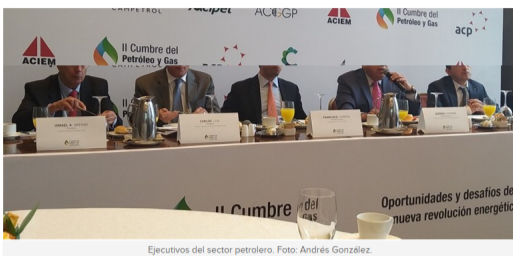
Ejecutivos del sector petrolero. PUBLICIDAD

La millonaria suma equivale a la inversión de los cuatro proyectos.