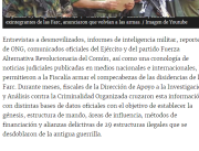
Exintegrantes de las Farc, armadores que relatan a la prensa.

Un informe elaborado por la Fiscalía detalla cómo operan estas estructuras legales, cómo se financian, su área de influencia y el peligro que constituyen hoy para la seguridad del Estado.