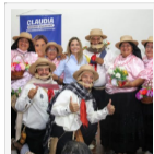
Asistencia real para el adulto mayor