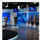
El Páramo de Santurbán, gran Ganador del debate del canal TRO