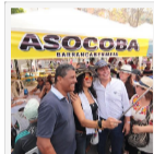
Circuito cultural de Bucaramanga tendrá un espacio para las colonias en el Parque la...