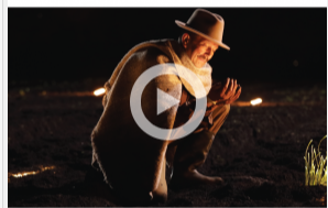
Llega Club Colombia Siembra, la cerveza producida por Bavaria con cebada 100% colombiana