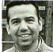
MAURICIO ZULUAGA Colaboración especial

Las elecciones del próximo 21 de octubre lucen como las más apretadas de los últimos tiempos en Canadá. Contrario a lo que pasó hace cuatro años, cuando los liberales obtuvieron el 54% de las sillas del Parlamento y ganaron el derecho a formar un gobierno mayoritario, las últimas mediciones muestran que lo más probable es que esta vez el partido que gane tendrá un gobierno minoritario o deberá formar una coalición política para poder regir los destinos de la nación.