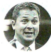
Andrew Scheer Líder del Partido Conservador

En los últimos días, el gobierno de Justin Trudeau anunció más beneficios económicos para los padres de familia.