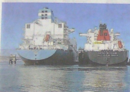
Terminal de regasificación en Barú.