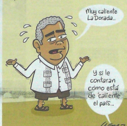
*con outfit de Silvia Tcherassi