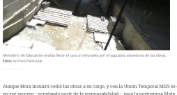
Ministerio de Educación evalúa llevar el caso a tribunales por el supuesto abandono de las obras.

“Como se observa, una de las causas que afectó la normal ejecución de los proyectos de infraestructura educativa fue la concentración de los acuerdos de obra en tres firmas contratistas, que infortunadamente empezaron a replicar los incumplimientos en prácticamente la totalidad de los acuerdos asignados”, dice el Ministerio de Educación en uno de los documentos.