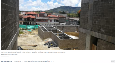
Así están las obras de la sede C del colegio Fray Julio Tobón Betancur en Carmen de Viboral (Antioquia).

RELACIONADOS: DENUNCIA, CONTRALORÍA GENERAL DE LA REPÚBLICA, MINISTERIO DE EDUCACIÓN, RSCAL GENERAL DE LA NACIÓN, COLEGIOS