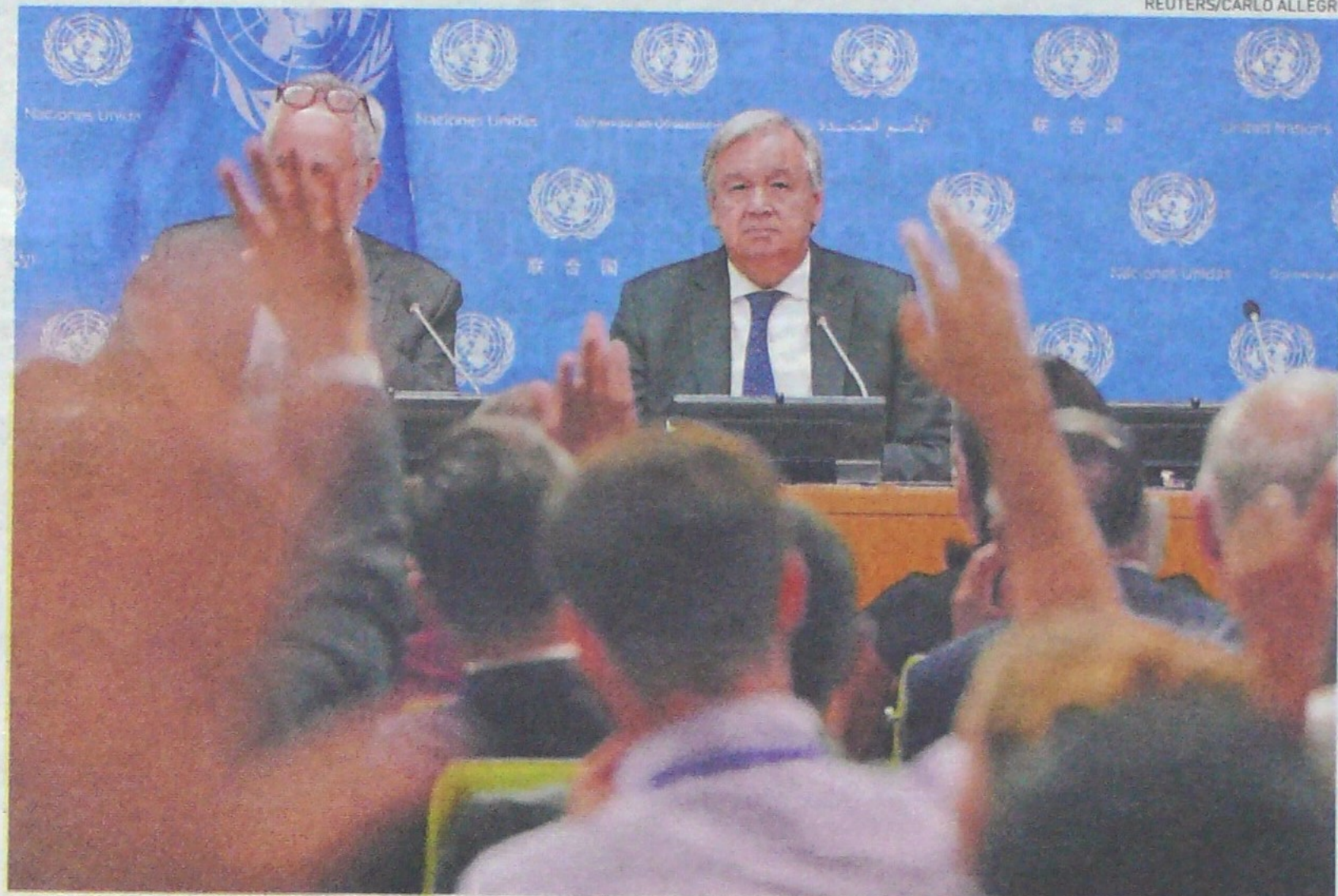
António Guterres será anfitrión de Asamblea General de la ONU desde el próximo martes en Nueva York. La cita promete controversia.

ble reunión con Guaidó, Guterres aseguró que no está prevista, pero recordó que Naciones Unidas mantiene “contactos regulares” con la oposición venezolana.