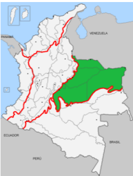
En color verde se resalta la Orinoquia colombiana

Recommended 0 | Share septiembre 18, 2019 8:43 pm