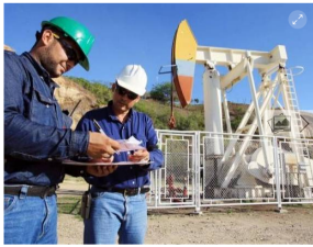
Fracking. Imagen de referencia.

La cuarta compañía es la Drummond que tiene un proyecto en la cuenca del Cesar. Aspira a extraer gas.