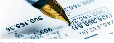
Así se calcula el escalafón

Las mil empresas incluidas en este escalafón facturaron en conjunto $20,2 billones durante 2018, una tercera parte de lo que vende Ecopetrol. Conozca los resultados de este año.