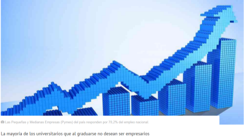
Las Pequeñas y Medianas Empresas (Pymes) del país responden por 78,2% del empleo nacional.

Las mil pequeñas y medianas empresas de mayor tamaño vendieron en conjunto el año pasado $20,2 billones. Son el segmento empresarial que genera más empleo, pero andan rezagadas en digitalización y en temas logísticos. Radiografía.