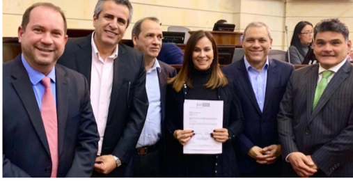
GRUPO DE SENADORES QUE RADICARON EL PROYECTO DE LEY: @MARITZA_SENADO