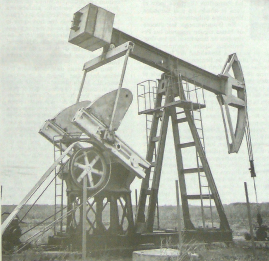
La estimulación hidráulica raramente puede generar sismicidad inducida. Las vibraciones que genera son 10.000 veces menores que las perceptibles por el ser humano.

No nos debemos dejar embaucar por personas mal informadas o populistas, la decisión del presente y el futuro de la industria minero-energética de Colombia está en nuestras manos.