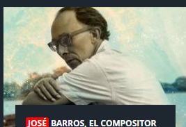
JOSÉ BARROS, EL COMPOSITOR DEL RÍO