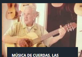
MÚSICA DE CUERDAS, LAS CANCIONES QUE NOS UNEN