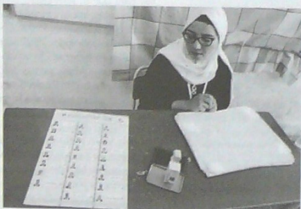
Los cerca de siete millones de tuncinos con derecho a sufragio deberán elegir entre 24 candidatos, después de que el sábado, dos de los aspirantes anunciaran su retirada.