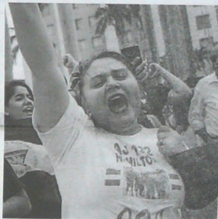
Oposición dice que Ortega vetó a OEA por temor a que se sepan "sus mentiras".

La Comisión Interamericana de Derechos Humanos (CIDH), que lamentó la decisión de Nicaragua, ha informado que la crisis en el país centroamericano ha dejado al menos 328 muertos desde el estallido social contra Ortega en abril de 2018.