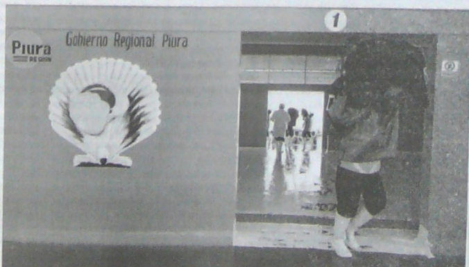
La producción nacional contabilizó 120 meses.

En 2018 tuvo un crecimiento de 4,0% frente a 2,5% en 2017 y 3,9% en 2016.