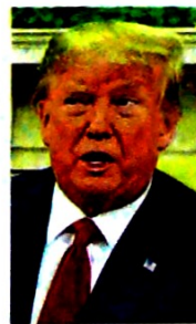
Trump dijo ayer que no quiere una guerra con Irán, pero advirtió que EE. UU. está "mejor preparado".

ayer esa opción, hasta que EE. UU. levante sus sanciones.