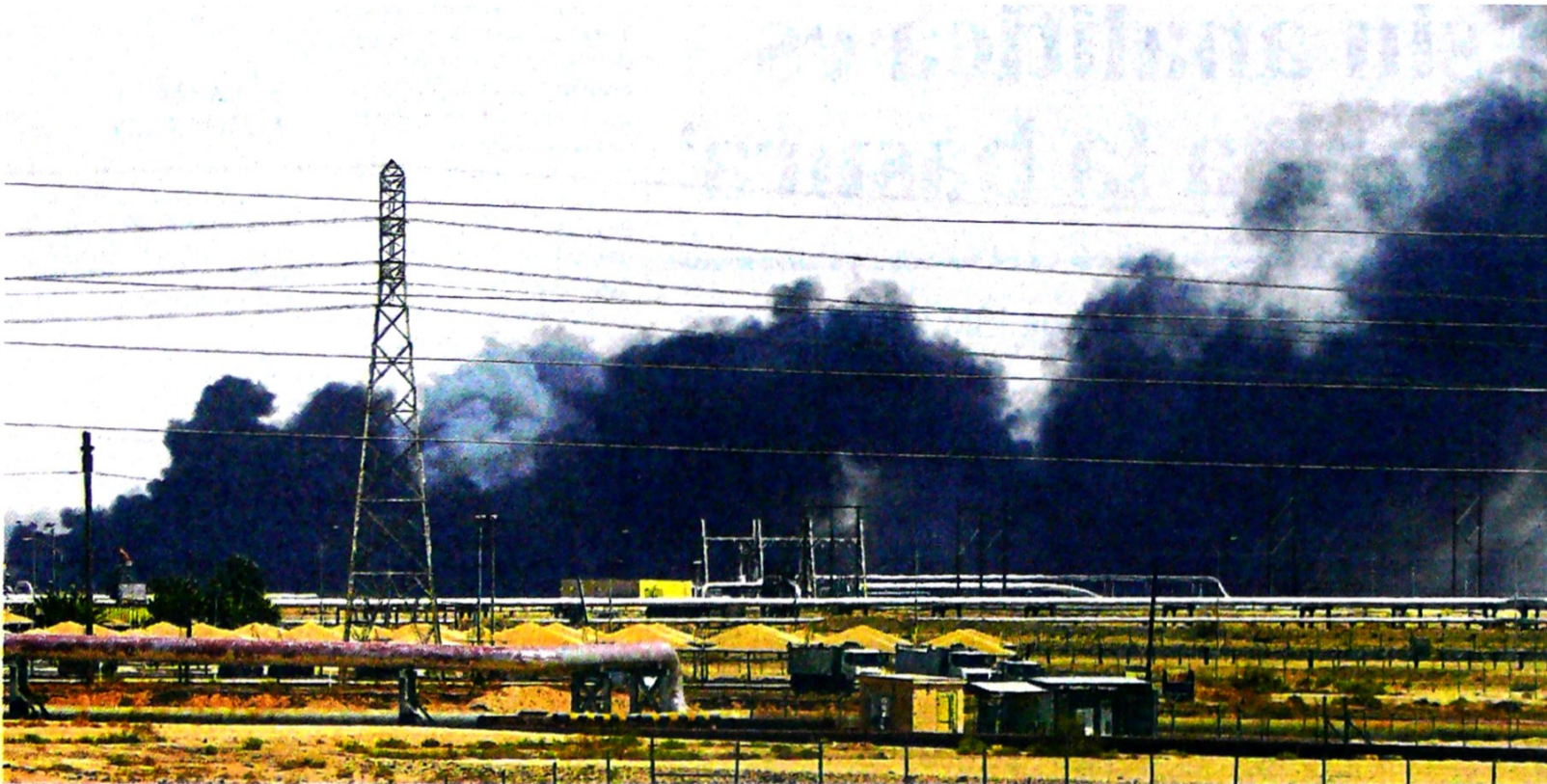
Para analistas y gremios del sector petrolero nacional, el atentado en Arabia Saudita no afectará el desarrollo de la operación en los campos.