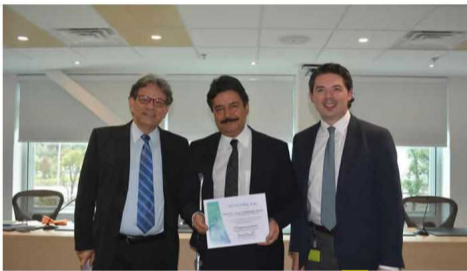
Dentro de los reconocimientos se encuentran una entregado por parte de Ecopetrol.