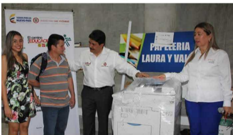
A nivel nacional se ha destacado la labor que ha hecho el Gobernador en pro de las víctimas.