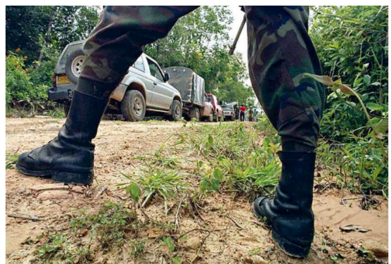
Soldado resultó herido con una mina antipersona en Arauca

Las autoridades del departamento de Arauca y Putumayo se encuentran en alerta máxima, tras la ocurrencia de varios hechos violentos que habría cometido la guerrilla del ELN a propósito de la conmemoración de sus 39 años.