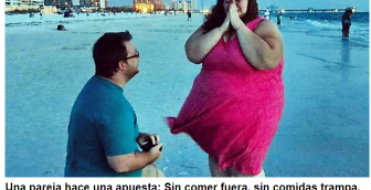
Trendscatchers | Patrocinado

Una pareja hace una apuesta: Sin comer fuera, sin comidas trampa, sin alcohol. Tras un año, así es como están