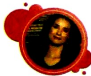
PAOLA REY ACTRIZ Y EMPRESARIA

DISFRUTA DE 3 MOMENTOS PARA REGALARTE UNA TARDE Y CELEBRAR EL AMOR