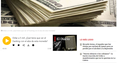
Ⓔ Dólar a 5 mil: ¿Qué tiene que ver el fracking con el alza de esta moneda?

La ministra de Minas, María Fernanda Suárez, aseguró que si Colombia no realiza esta técnica, el dólar se dispararía hasta ese valor. ¿Si podría pasar? ¿Cuál sería ese impacto? El tema de hoy en El Diario el podcast de SEMANA.