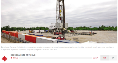
Ⓔ No hacer fracturación hidráulica provocaría una caída en las exportaciones, lo que dispararía el precio del dólar y obligaría al país a importar petróleo. Y le dejaría sin la plata de impuestos y regalías que genera el sector.

El Consejo de Estado, al suspender el fracking, dejó en el limbo las pruebas piloto. Una mala noticia para la estabilidad de las finanzas públicas, el financiamiento de programas sociales y la sostenibilidad energética.