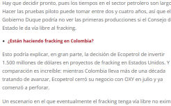
Rarero Páez Guerrero. El magistrado del Consejo de Estado mantuvo la suspensión del fracking. Argumenta que puede generar efectos en el medioambiente y la salud humana.

Si caen las exportaciones y las divisas que ingresan por inversión, el dólar podría dispararse. La ministra Suárez advirtió que podría llegar hasta 5.000 pesos, pero otros analistas mencionan que llegaría a 7.000 pesos.