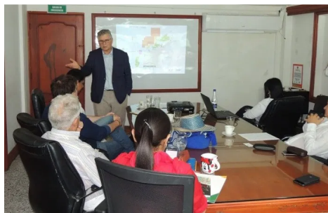
Aspecto de la socialización del proyecto que se realizó en el despacho del gobernador de parte de Ecopetrol.