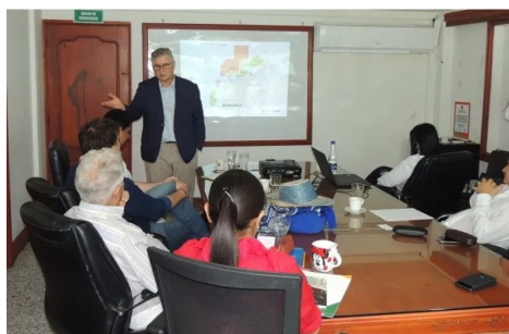
Aspecto de la socialización del proyecto que se realizó en el despacho del gobernador de parte de Ecopetrol.