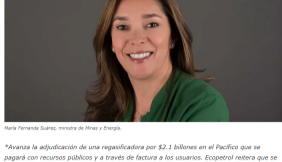
María Fernanda Suárez, ministra de Minas y Energía.

"Avanza la adjudicación de una regasificadora por $2.1 billones en el Pacífico que se pagará con recursos públicos y a través de factura a los usuarios. Ecopetrol reitera que se afectaría el valor de la empresa. Gobierno insiste en crisis energética por ausencia de fracking. Informes de entidades del sector y gremios advierten lo contrario.