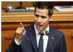
Juan Guaidó, presidente interino de Venezuela.

La presidencia encargada de la República de Venezuela, encabezada por Juan Guaidó, rechazó este viernes los ataques con explosivos perpetrados por la guerrilla del ELN en Colombia.