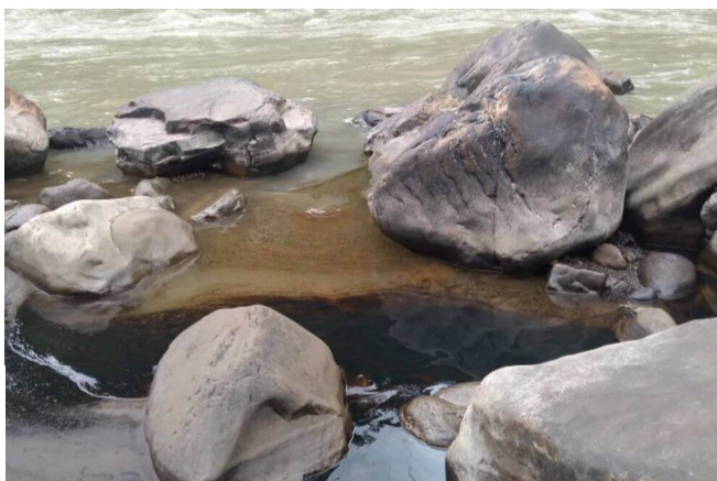
La empresa petrolera alertó sobre los posibles riesgos de explosión en la zona debido al derrame de hidrocarburo en Toledo.

La filtración del petróleo se produjo por un atentado terrorista al oleoducto Caño Limón-Coveñas. El crudo llegó al río Cubugón. Según Ecopetrol , los responsables del hecho serían grupos al margen de la ley.