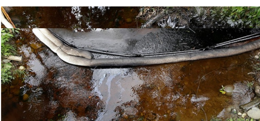
Imagen de referencia.

La Empresa le pide a la comunidad alejarse inmediatamente del lugar del derrame causado por un atentado al oleoducto Caño Limón-Coveñas.