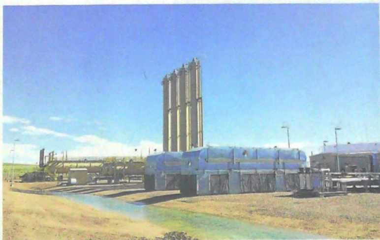
Yenny Rodríguez Barajas / VANGUARDIA

El Alto Tribunal derrotó la ponencia que proponía dar vía libre al ejercicio del fracking, mientras se define si su reglamentación es legal o no.