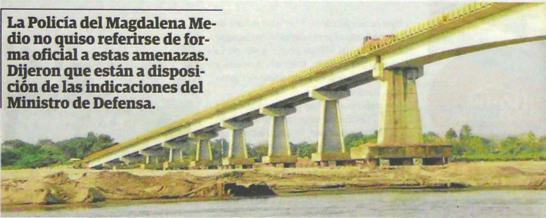
El puente Guillermo Gaviria Correa que conecta al Puerto Petrolero con Yondó, sería uno de los principales objetivos militares por parte de los aviones de guerra de Venezuela según el líder chavista.

La Policía del Magdalena Medio no quiso referirse de forma oficial a estas amenazas. Dijeron que están a disposición de las indicaciones del Ministro de Defensa.