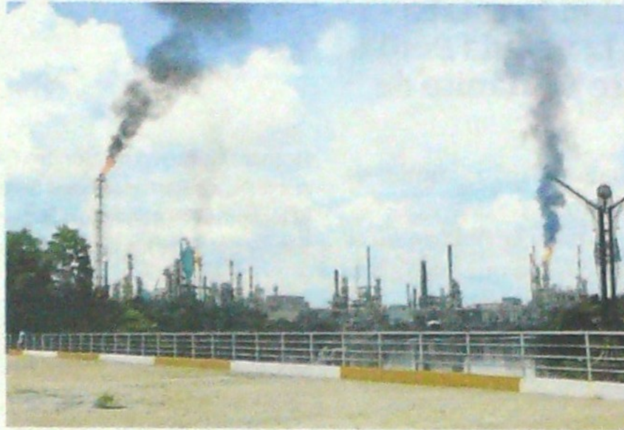
Conocen claramente que la refinería más grande de Colombia está en el Puerto y que sería uno de los objetivos si se invade el vecino país

"Si nos agreden tenemos que defendernos. Tenemos todas