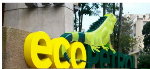
Ecopetrol aportará $36.000 millones para que jóvenes accedan a educación superior.

Desde Caquetá, el presidente de Ecopetrol , Felipe Bayón, anunció un aporte de $36.000 millones, durante los próximos 4 años, para el programa Generación E.