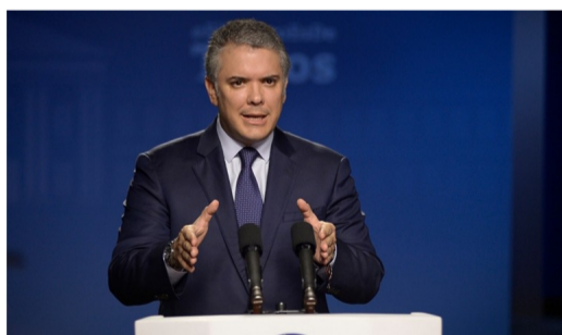
Duque descarta propuesta de la ONU de un diálogo con Maduro.

El presidente Iván Duque reaccionó a la propuesta de la ONU para que Colombia y Venezuela entablen un diálogo ante la grave tensión en sus relaciones.